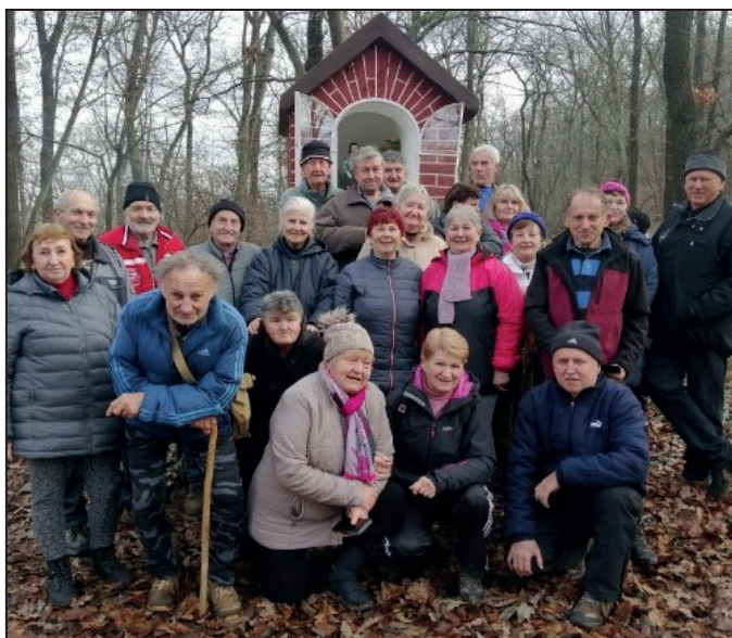
Tradičné stretnutie členov JDS Veľký Klíž a JDS Kolačno pri kaplnke sv. Rodiny na Cerkoch sa konalo 29.12.2023. Remizová zostava 13:13 bola aj vďaka účasti nečlenov z Klíža.