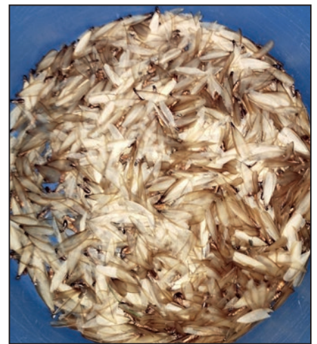
Termity s krídlami.

Medzi zaujímavosťami alebo skôr získanie nových informácií patrí aj podnebie a celkovo ráz krajiny. Uganda je asi 5x väčšia ako Slovensko a má takmer 10x viac obyvateľov ako naša krajina. S rozlohou územia