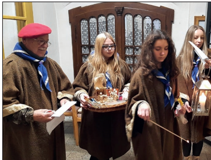
Skauti z Bošian priniesli betlehemske svetlo.