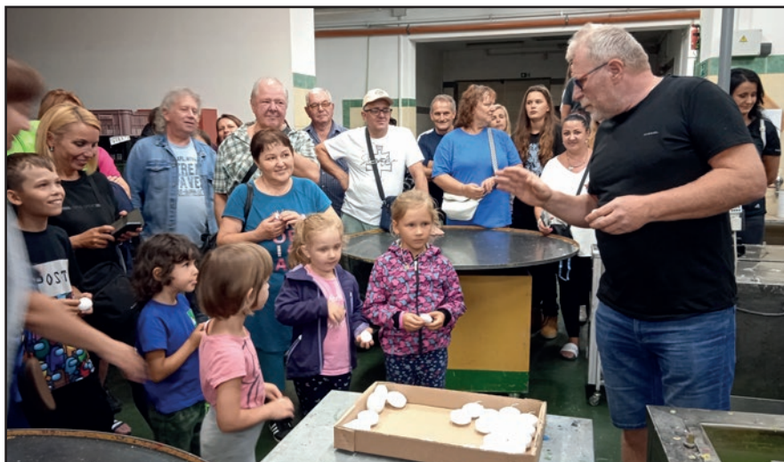
Účastníci zájazdu na exkurzii vo výrobní sviečok.

navštívime. Mimochodom rozlohou najväčší v strednej Európe. Práve sa koná Festival remesiel a kováčov, takže je čo pozerat'. Poobede odchádzame znovu do Kopřivnice, kde je pre mnohých pripravený vrchol zájazdu – návšteva múzea náklad-