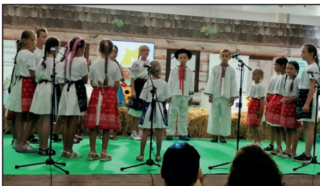
Z vystúpenia DFS Kostrínček.