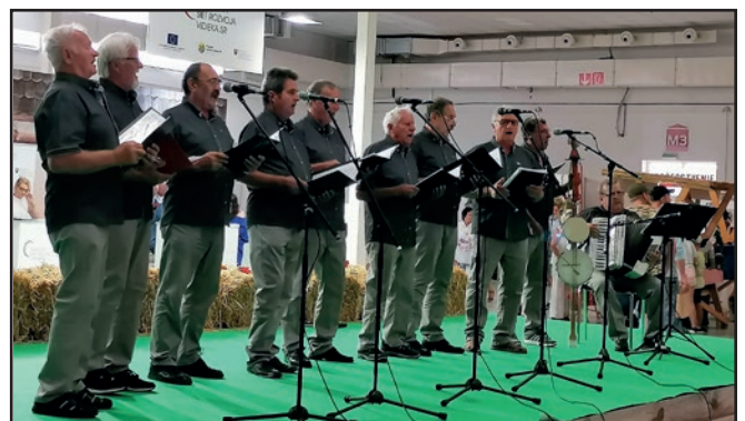
Mužská spevácka skupina Klížania.