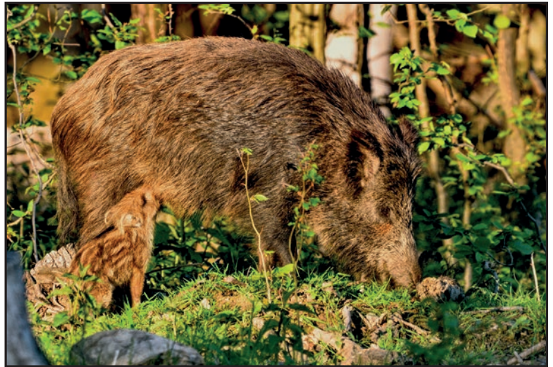
Ocenená fotografia Tomáša Kňaze.