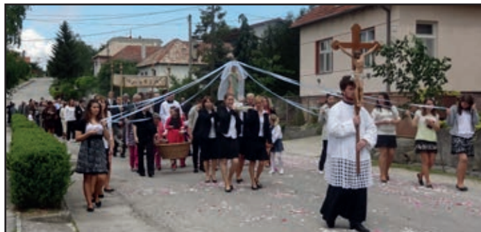
▪ Slávnostný sprievod v Klížskom Hradišti (zmienka o podujatí na str. č.2.).