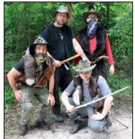
▪ Pri zbojníkoch bolo veru počuť aj plač tých najmenších...