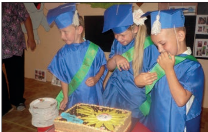
▪ Absolventi MŠ v akcii – pred slávnostným rozkrojením torty.