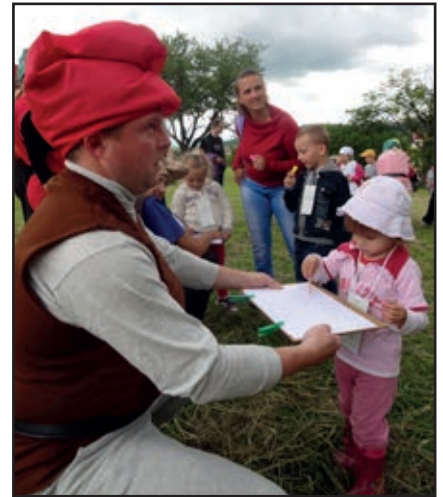
▪ Trpaslíci vyskúšali deti ako maľujú.