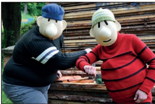
▪ Ani táto dobre známa dvojica v rozprávkovom lese nemohla chýbať...

Slniečko pekne svietilo a zvedavé deti sa plné očakávania a radosti vydali na cestu plnú prekvapení. Tešili sa zo stretnutí s kráľovnou, zasúťažili si pri veľkom snehuliakovi, ktorému tentoraz robil spoločnosť aj strašiak, ktorý akoby prišiel z blízkeho poľa. Veľa radosti priniesli súťaže. A nielen tie. Trpaslíci so snehulienkou deti vyskúšali z toho, ako vedieť maľovať. Malý hříbik sa spod svojho klobúčika mračil na zachmúrenú oblohu a ani nesmelá Červená čiapočka sa príliš neusmievala. Známi Pat a Mat majstrovali aj keď sa už počasie celkom pokazilo a začalo pršať. Pri poľovníkoch si deti vyskúšali svoju bystrosť a vedomosti, pri motokrosároch svoje strelecké