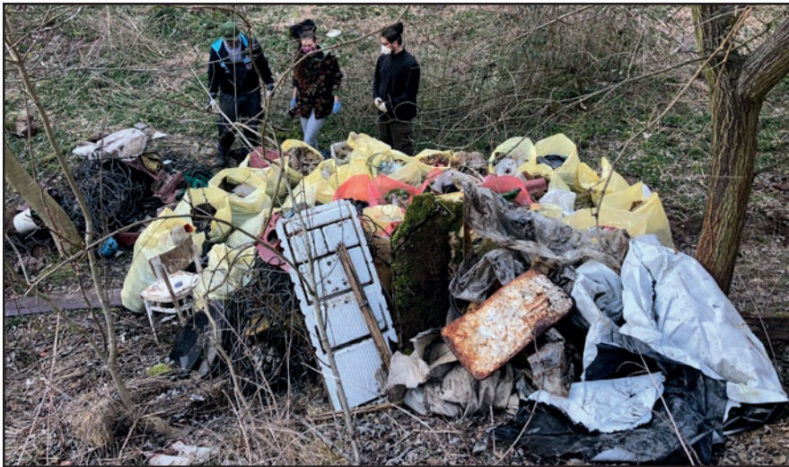
Pohľad na takéto množstvo odpadu vyzbieraného v Zbudove je desivý!