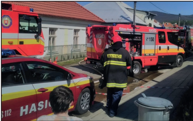
Počas požiaru bolo na Klíži naozaj rušno....

zaznamenali až tri požiare v priebehu šiestich dní (!).