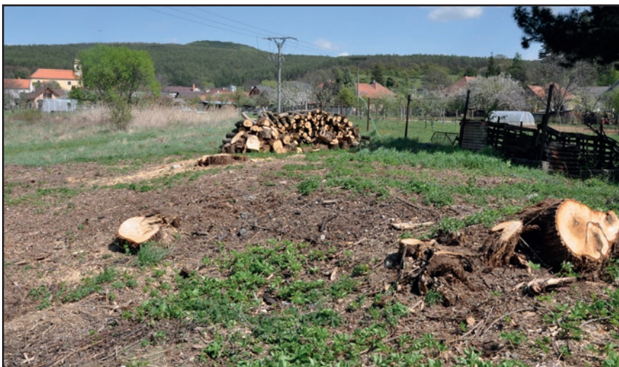
Prístup občanov ku svojmu okoliu je všakovaký. Tých nevšímavých sme uviedli viacero.