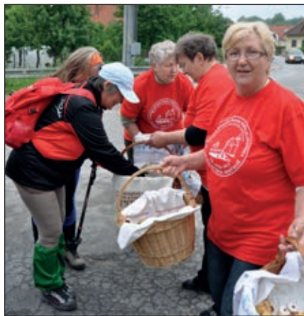
▪ Srdečné ranné víťanie návštevníkov v centre obce turistkami z domáceho KST Ostrá.