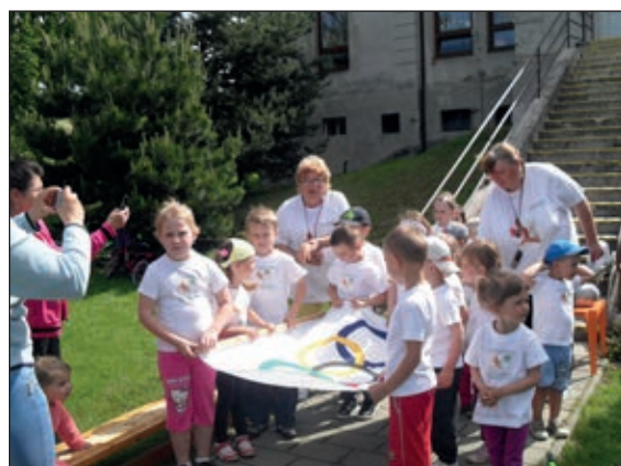
▪ Ako na skutočnej olympiáde. Ako naozajstný ceremoniál. (O olympiáde detí viac na str.č.2.)

voľného času. Tiež ale aj nadšenia a oduševnenia pre to, aby sa konečný cieľ vydaril. Konečne tu bol predposledný májový víkend.