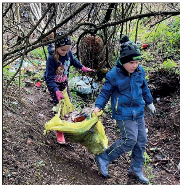
■ Aktivity k očisteniu našej prírody a okolia obce sme znamenali v rámci Dňa Zeme. Pracovalo sa na viacerých miestach v rôznom čase. Zapojené do týchto aktivít boli aj deti. Zaiste ten najlepší spôsob k výchove ich kladnému vzťahu k životnému prostrediu.

Kto sa nepresvedčil, možno ani neuverí. Na Besiedkach, v jarku vedľa plotu cintorína sa v zarastenom teréne „ukrývalo“ nevidané smetisko. Miesto plné odpadu. Nielen cintorínskeho. Ako pochopiť, že tam boli, okrem iného, aj staré koberce, torzo plechového suda, či školská aktovka? Zmeniť tento neutešený stav a neskutočne bezohľadné znečistenie bezprostredného okolia obce a zároveň posvätného miesta, akým cintorín zaiste je, sa rozhodli v OZ Tu žijeme. V spolupráci s obcou Veľký Klíž, Klubom dôchodcov a ZŠ Klátova Nová Ves zorganizovali brigádu s názvom „Čisto vedľa cintorína“. Konala sa v sobotu 15. apríla. Niekoľko dospelých spolu s deťmi vyzbieralo skoro neuveriteľných 25 (!!) vriec odpadu. Ich úsilie bolo a je mimoriadne chvályhodné. Tak isto ako brigáda Klubu dôchodcov v utorok 18. apríla, počas ktorej sa v čistení danej lokality pokračovalo. Vidieť členky klubu predierajúce sa lesným porastom stúpajúc strmým svahom s vrecami odpadu v rukách. Následne kráčajúcich uzúčkým chodníkom povedľa plotu k priestranstvu za plotom konča cintorína. Skutočne nemalé úsilie a ťažká práca s výsledkom vyzbieraných ďalších vyše dvadsať vriec odpadu. Je potrebné aj na tomto mieste oceniť a vyzdvihnúť námahu všetkých, ktorí na spomínaných brigádach svojou prácou prispeli k očisteniu dlho zanedbávaného miesta. Po týždni, v sobotu 22. apríla OZ Tu žijeme opäť upratovali s deťmi toto, tak dlho zanedbávané miesto. Vyzbierali 32, tentokrát menších 60 litrových vriec. A stále to nie je čisté.