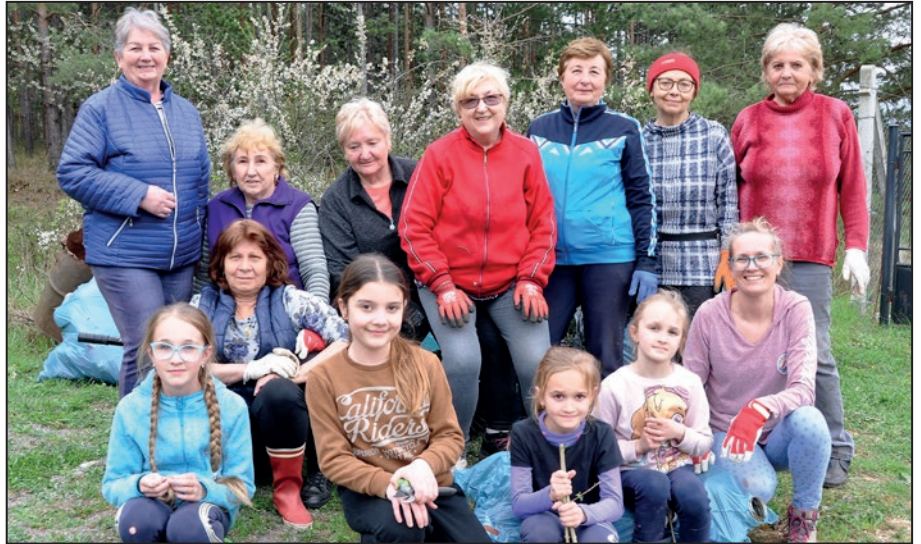
■ Členky Klubu dôchodcov spolu s mladými pomocničkami na brigáde v utorok 18. apríla.