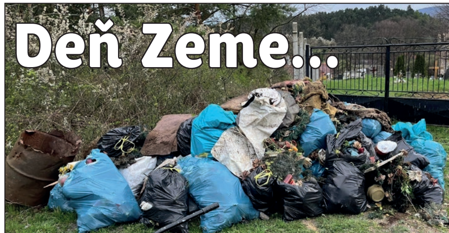
■ Takéto množstvo odpadu vyzbieraného za pár hodín na jednom mieste? Áno, v jarku povedľa cintorína v Klížskom Hradišti!