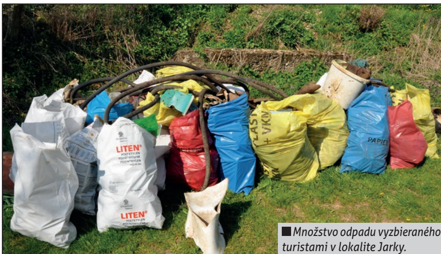
■ Množstvo odpadu vyzbieraného turistami v lokalite Jarky.

tabule - mapy od kultúrneho domu do doliny. Následne bola inštalovaná na mieste, kde sa rozchádzajú dve cesty, jedna smerujúca na ihrisko Hôrka a do Ovsenišťa, druhá na Vrch Horu. Štvorica turistov sa okrem osadenia tabule postarala a previedla aj úpravu terénu.