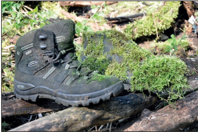
■ Aj kusy obuvi známych značiek sa objavili v množstvách odpadu...

Druhou aktivitou turistov bolo prenesenie informačnej