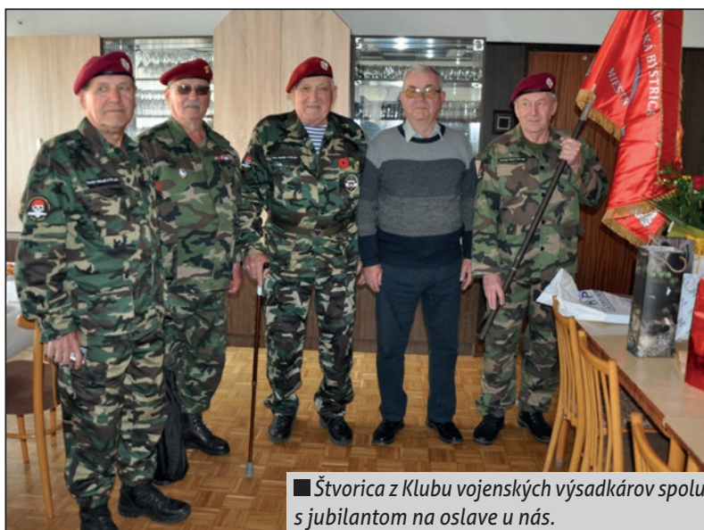
■ Štvorica z Klubu vojenských výsadbárov spolu s jubilantom na oslave u nás.