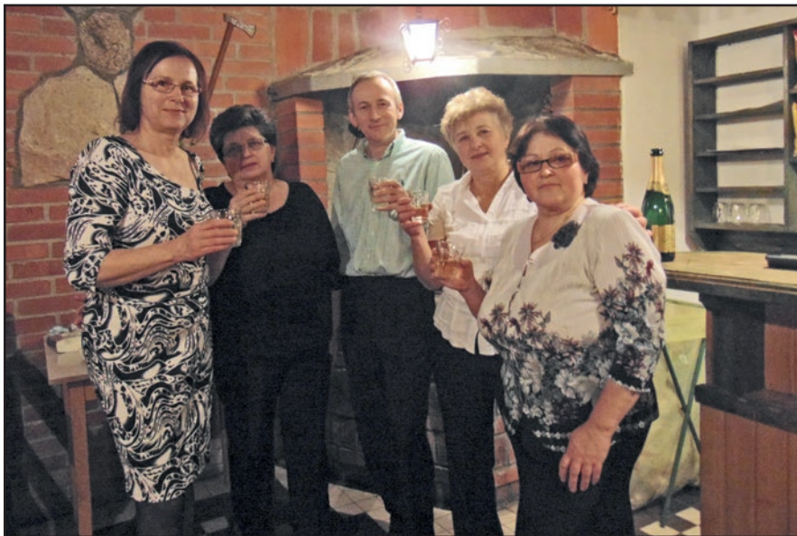
■ Veselé chvíle posledných hodín roka minulého a prvých chvíľ toho nového...

■ Dvadsať rokov našej histórie je ukrytých aj v týchto knihách. Týmto vydaním vstupujeme do tretieho desaťročia existencie Nového Clusu.