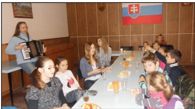
■ Vyhodnotenie koledovania Dobrej noviny sa uskutočnilo 29.decembra v zasadačke Oců.