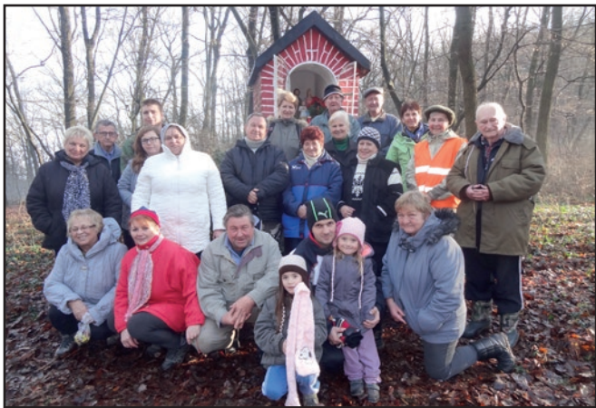
■ Každoročné stretnutia pri kaplnke sv. Rodiny na rozhraní hradišského a kolačianskeho chotára sú pre tých, ktorí sa ich zúčastňujú už pevnou súčasťou sviatočného obdobia.