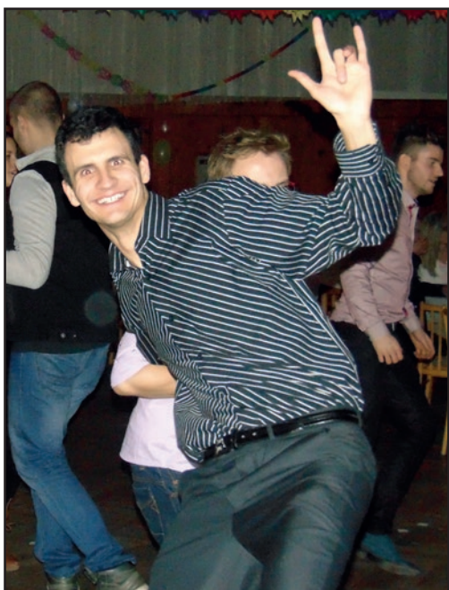
■ Okrem iných sa na Silvestrovskej zábave dobre bavil aj jeden z našich dvoch futbalových spravodajcov.