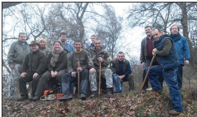
■ Skupinka brigádnikov, vďaka ktorým ste sa všetci tí, ktorí ste navštívili Michalov vrch v závere alebo na začiatku roka nového mohli zohriať pri ohni.

○ Už naozaj veľa rokov pretrvávajúca dobrá tradícia, kedy sa skupinky priaznivcov turistiky v medzivosiatkovom období v závere roka stretávajú na Michalovom vrchu. Cieľom nie je v tomto prípade turistika. Už tradične sa tam koná brigáda. Jej účastníci chystajú drevo a čistia priestory najnavštevovanejšieho