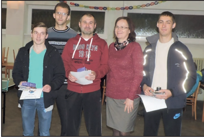
■ Najúspešnejší „amatéri“ novoročného stolnotenisového turnaja.