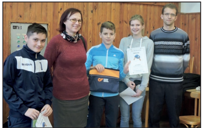
■ Ocenení hráči v kategórii dorastu.