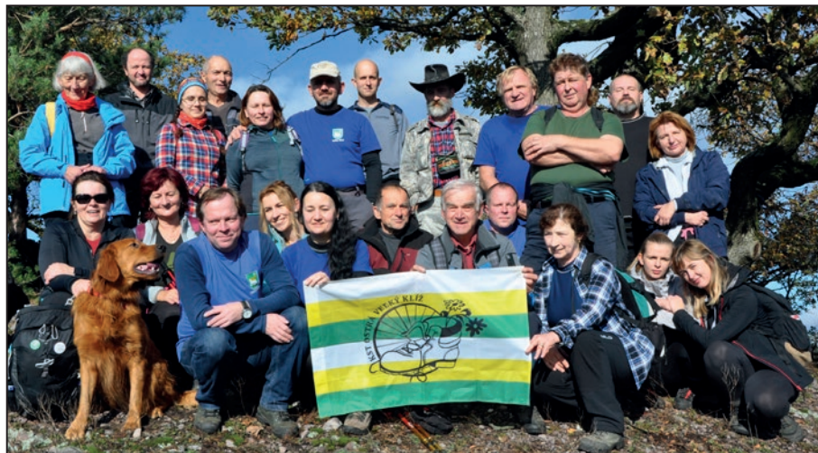
■ Spoločná foto sa tentoraz robila na Malej Ostrej.