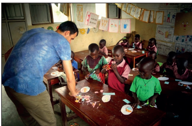
■ Z triedy v škôlke v rámci centra GOL, kde sme robili nejaké aktivity.