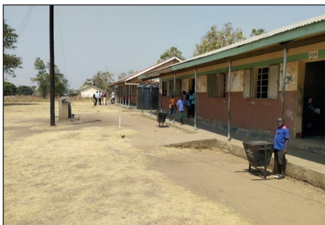
■ Areál miestnej ZŠ, kam chodili naše deti z centra.

na školné. Škôlky boli rozdelené na tri ročníky (označené určitými názvami zvieratiek), kde od prvého ročníka chodili tí najmenší po tých najväčších. Stalo sa, že do najnižšej triedy nastúpil žiak, ktorý mal aj 6 rokov, pretože predtým nemali finančné či iné možnosti na nástup a pravidelnú dochádzku do škôlky. Dochádzka