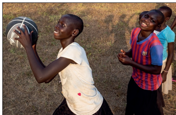
■ Oblúbená hra chlapcov – basket.

na základných školách v Ugande bola od 1. do 7. ročníka. Taktiež vek nie vždy zohrával rozhodujúcu úlohu pri nástupe do školy, či do konkrétneho ročníka. Aj v našom centre bolo pár detí, ktoré síce boli v 7. končiacom ročníku na základnej škole, ale mali aj 18 rokov. Moje prekvapenie nastalo aj vo chvíľach, keď žiak neprišiel do školy z dôvodu, že musel ísť pracovať na pole, keďže bolo obdobie vhodné na sadenie či obrábanie pre ich životy dôležitých produktov. V našej krajine či kultúre v súčasnosti nepredstaviteľné. Na druhej strane, my nemáme v rámci hierarchie potrieb takéto problémy, keďže základné ako hlad, smäd, spánok, máme vo väčšine prípadov uspokojené a pokiaľ nie je uspokojená nižšia úroveň tohto rebríčka, nemáme potrebu ani túžbu ísť vyššie. Takto to, žiaľ, v Ugande funguje takmer na dennom poriadku. Momentálne pôsobím opäť v školstve a vidiac dnešné niektoré „rozmaznané“ deti (možno rozmazaných rodičov), voziace ich takmer v ich dospelom veku autom až pred dvere školy, mi príde v porovnaní s chudobnými deťmi, ktoré v šľapkách a pár školskými potrebami v igelitovom vrecku, v horúčavách dochádzajú pešo, možno aj hodinu, po prašných cestách až príliš nespravodlivé a smutné.