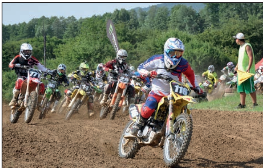
▪ Na trati Brody v Ješkovej Vsi sa uskutočnili medzinárodné motokrosové preteky. Snímka približuje situáciu krátko po štarte v jednej z kategórií (viac o podujatí na str.č.4 a str. č.6).