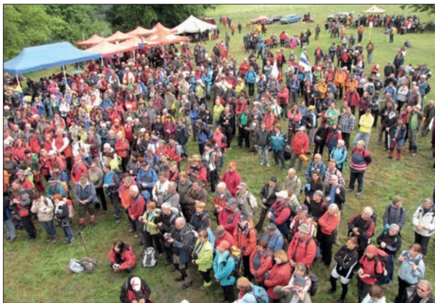
▪ Davy ľudí na Vrch Hore.

Prvé boli povolenia. Už na jeseň a v závere roku 2012 vydali súhlas na konanie všetky dotknuté úrady a organizácie. Začali prípravy. Bolo treba vynaložiť veľa úsilia, obetavosti,