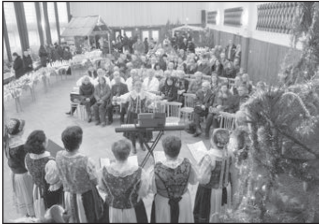
■ Sviatočná atmosféra v kultúrnom dome „pár hodín“ pred Via- nocami.

A ešte desiatky iných trblietavých krás, ktoré je aj ťažko pomenovať.