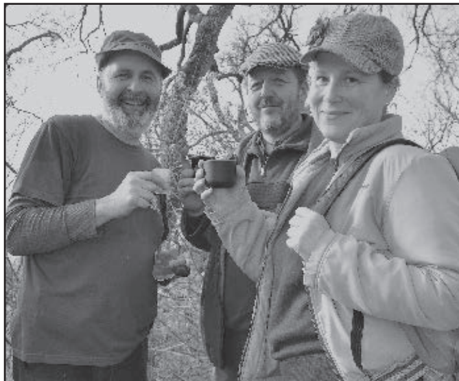
■ Pohodovú atmosféru trojkráľového výstupu potvrdzuje aj pohľad na túto trojicu.