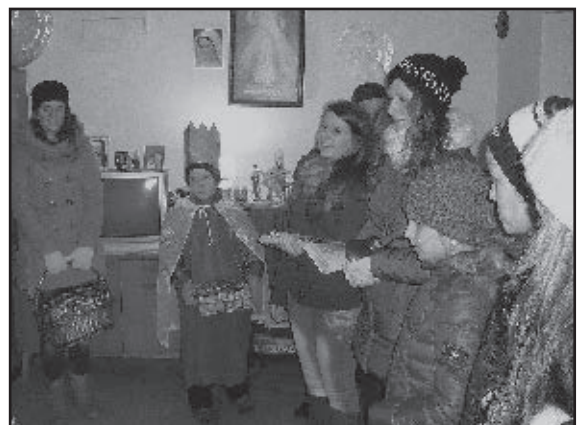
■ Mladí koledníci počas návštevy v jednej rodine.