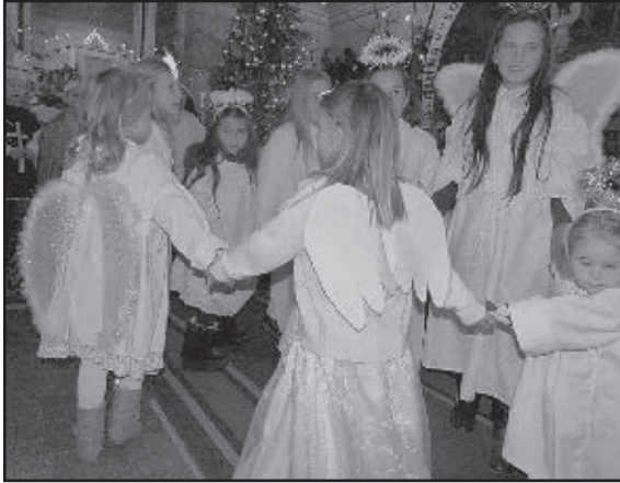
■ Momentka z vystúpenia detí na Jasličkovej pobožnosti.